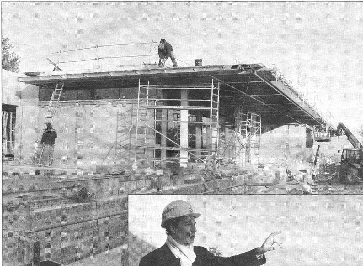
Le Visitor Center s'étend sur deux étages, dont un seul est apparent. Il a été conçu comme le complément idéal de la visite du cimetière américain de Colleville.

A l'intérieur, les salles se multiplient. Le hall d'accueil, suivi de la pièce destinée au recueillement des familles, ou encore la galerie de l'ABMC, à l'étage supérieur. En dessous, on entre dans le vif du sujet : « Nous avons voulu créer une atmosphère totalement différente. Autant, au-dessus, nous avons privilégié les grandes verrières, autant ici les murs en béton brut et le plan-